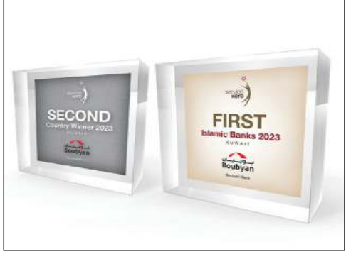
جوائز سيرفيس هيرو